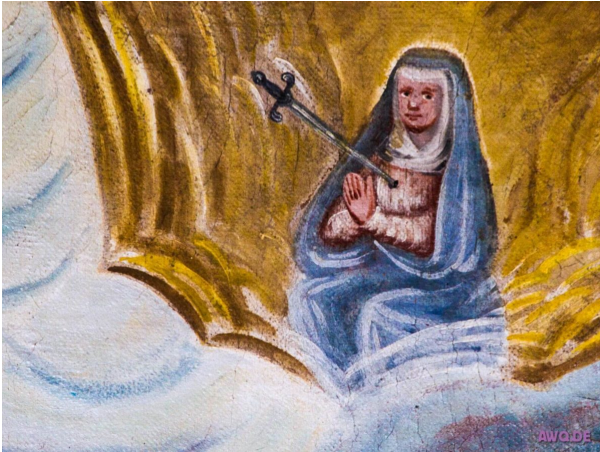
Kirche trifft Kultur

Zahllose Fundstücke und Relikte belegen, dass der Zusammenhang von Kultur und Religion natürlich keineswegs auf die christliche Kirche beschränkt ist, wie Herr Buß es mit seiner Einleitung suggeriert.