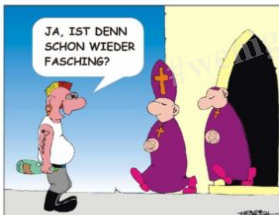
Cartoon: Rolf Heinrich

Statt den Karneval als heidnisches und/oder potentiell „sündiges“ Treiben zu verteufeln, ist man kirchlicherseits dazu übergegangen, mit den Karnevalisten anzubandeln.