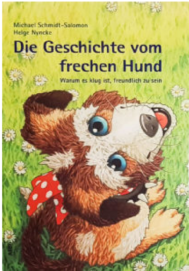
Die Geschichte vom frechen Hund

Es gibt viele schöne Märchen und Erzählungen, die menschlich, unterhaltsam und lehrreich sind. Es ist nicht schwierig, sie zu finden. Andere Märchen ermöglichen es auch, Kindern schwierige oder traurige Themen näherzubringen, und zwar in einer Art abgesichertem Modus. Denn bei Märchen können Kinder meist schon erstaunlich früh zwischen Fiktion und Realität unterscheiden.