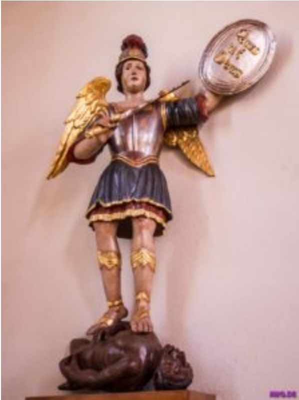
Gut und Böse aus religiöser Sicht